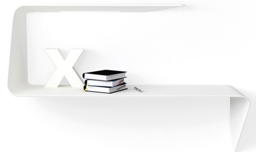
mamba shelf/desk, MDF italia designer victor vasilev, 2012