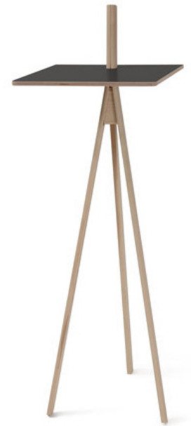
der kleine lehrer, moormann designer jörg gätjens, 2003

anforderung: plakat A0, modell, dokumentation A4 hoch (projektdokumentation inkl. modellfotos, rendering, etc.)