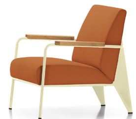
fauteuil de salon, 1939

- darstellung des stuhls in den relevanten ansichten, plakat A0 - rendering und fotomontage, plakat A0 - funktionsfähiger prototyp mst.1:1 - projektdokumentation paperback A4 hoch