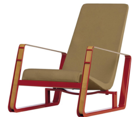
cité armchair, 1930

mindestens drei konzepte. präsentation pro konzept ein plakat A0. grundlegende konzeption in form und konstruktion, ideenansätze, statik, anwendung und materialeinsatz. in der konzeption werden gleichzeitig immer mehrere varianten anhand von modellen und skizzen entwickelt.