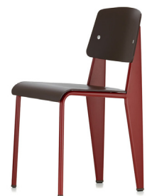
standart chair, 1934/50

designmodell (weiterentwicklung modell aus entwurfsbesprechung) besitzbares ergonomiemodell 1:1 (material frei), aufbau 3d modell