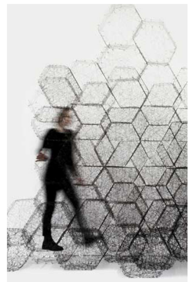
textilmuseum st.gallen ausstellung „neue stoffe - new stuff. gestalten mit technischen textilien“

ausstellung bis zum 2. april 2018 www.textilmuseum.ch